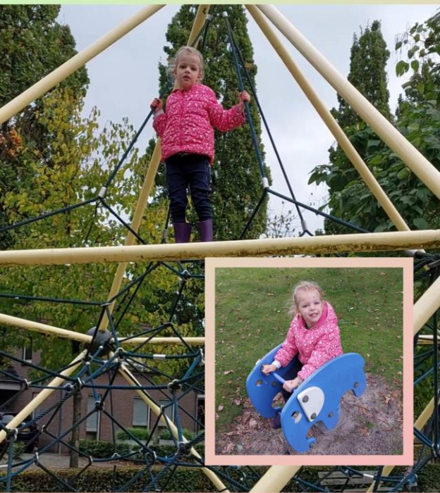
leuke speeltuinen tocht