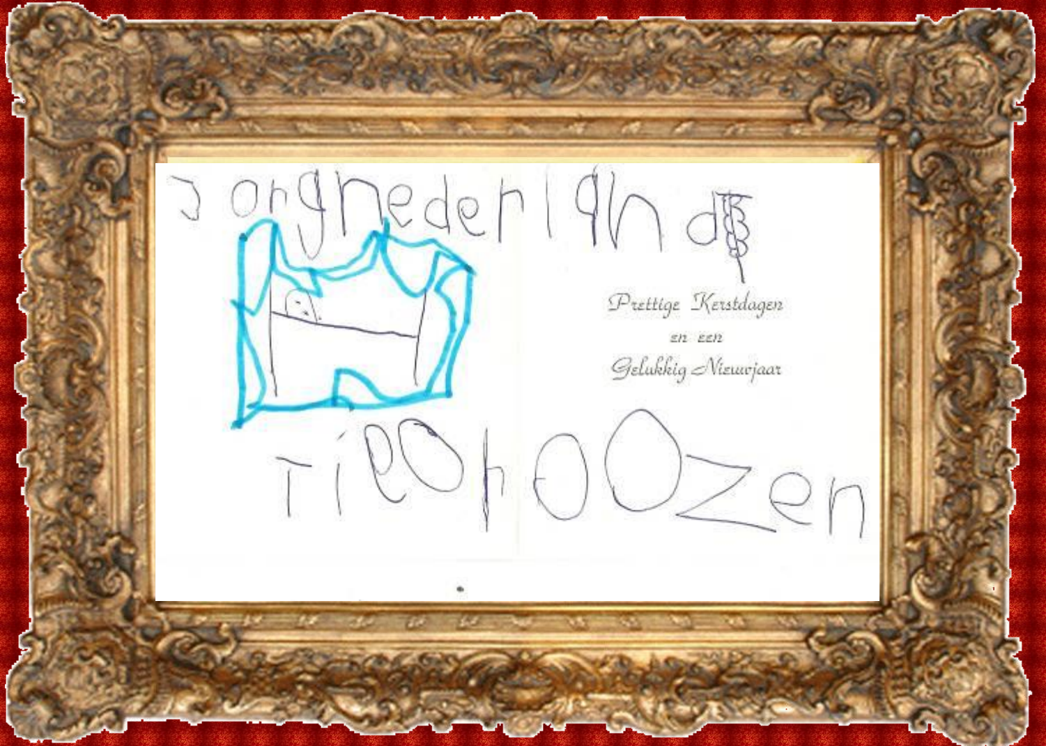
Deze Kerstkaart kregen we van Minioor Tigo