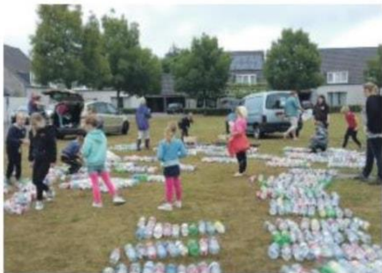
▲ Goede Doel Dag 2017 was een succes

Ze gaan rond in de ochtend en hopen alle straten te hebben bezocht aan het eind van de actie ochtend.