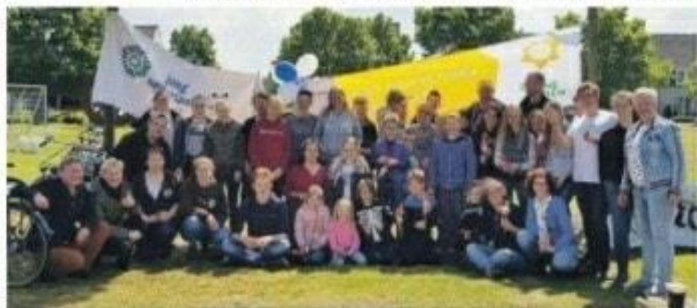
Jong Nederland Diessen zette zich vol overgave in voor hun jaarlijkse Goede Doelen Dag.

Het voelt voor Jong Nederland Diessen goed dat ze een steentje bij hebben kunnen dragen, en er op kunnen vertrouwen dat er leden, ouders en vrijwilligers zijn waar je op kunt rekenen en dat de gehele gemeenschap, van bedrijven tot inwoners, een gevoel van samenhangheid creëert en ergens voor gaat. Het een welgemeend Dank je wel!