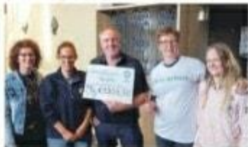
Ook stichting DeJuwijn heeft een mooie cheque in ontvangst mogen nemen.

Het was de derde editie, ervaring was er en toch wisten ze als organisatie niet wat hen precies te wachten stond. Een draaiboek hadden ze al, de goede doelen waren snel gekozen, maar dan gaat het echte werk van start.