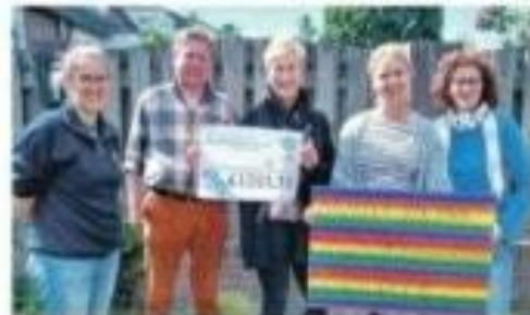
Zonnebloem Diessen-Bronschot Hogehorst heeft een mooi bedrag in ontvangst genomen.