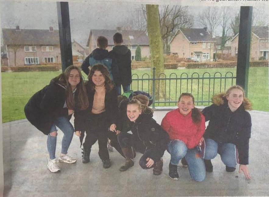
Snel even bij elkaar voor een groepsfoto

Op de Facebookpagina van Jong Nederland Diessen zie je wekelijks een update van een aantal groepen wat ze hebben gedaan. Voor meer informatie over de groepen en de vereniging verwijzen we iedereen naar de website van Jong Nederland Diessen.