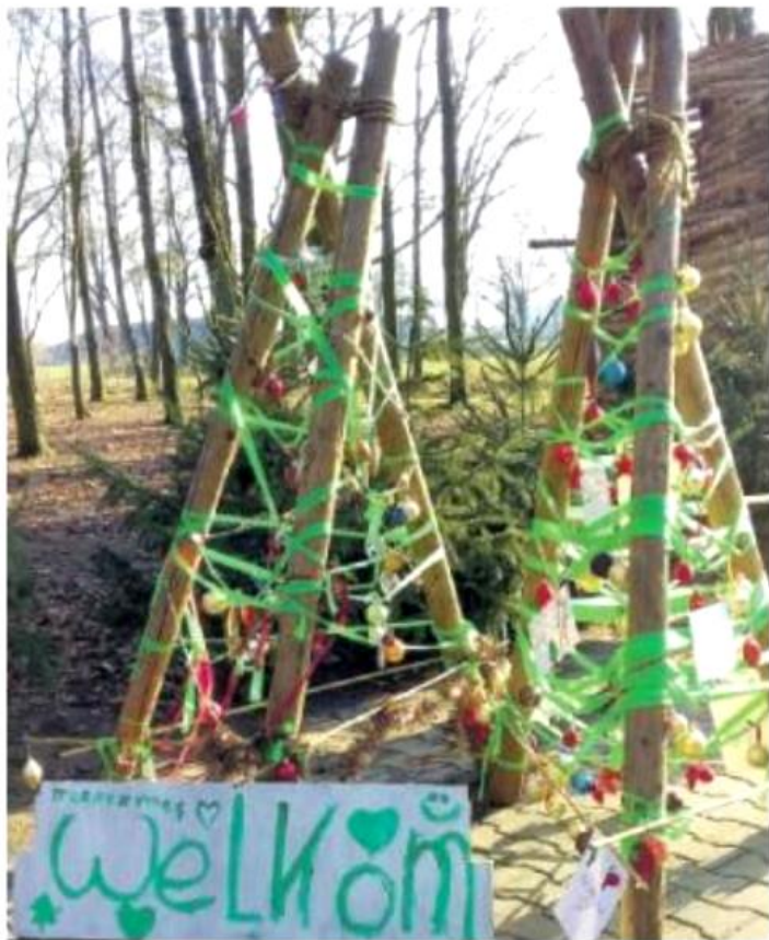
▲ Iedereen was welkom!

men wat op bordjes werd gelegd en uitgedeeld. Jong Nederland Diessen zorgde voor het drinken dat iedereen gratis mocht nemen. Een aantal leden zorgde ervoor dat de glühwein en cho-