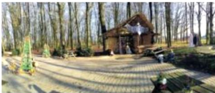
▲ De Kerststal

De vrijwilligers sloten de avond af bij het kampvuur en bij de evaluatie werd al besloten dat er in 2019 weer een Kerststal avond editie komt... de nieuwe ideeën liggen er al!