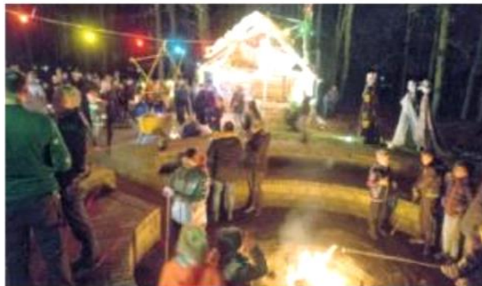
▲ Sfeerimpressie, al is deze moeilijk in een foto te vangen.

comel warm in de bekers kwam terwijl vrijwilligers toezicht hielden bij het kampvuur en hielpen bij de knutseltafel. Bij de tafel stond de kerstboom die versierd was door de jongste leden, de Minioren. Zoals zij de kerstboom versiering hadden genaakt, met binddraad en strijkkralen, zo kon nu iedereen iets maken voor in de boom of voor thuis.