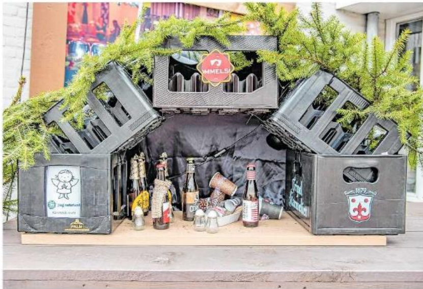
Laat je fantasie de vrije loop!

De Kerststal route wordt dit jaar voor de derde keer georganiseerd. De route bestaat uit ver-