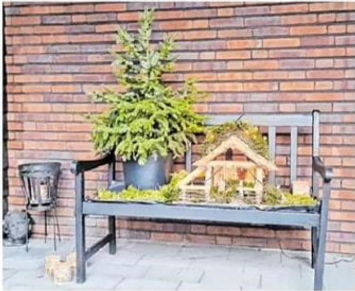
Kerststal in Biest-Houtakker

De kerstvakantie is weer voorbij en de scholen zijn weer begonnen. Maar er is nog wél wat moois om op terug te kijken. Dankzij Jong Nederland Diessen en de Werkgroep Kerst Route Biest was de kerstvakantie in beide dorpen verre van saai. Een overzicht van de activiteiten.