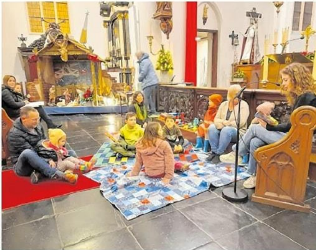
Voorlezen kerstinloop Diessen

Al met al kunnen Diessen en Biest-Houtakker terugkijken op een meer dan geslaagd evenement. Uiteraard met dank aan alle deelnemers, want zonder hén zou er geen Kerststal route zijn!