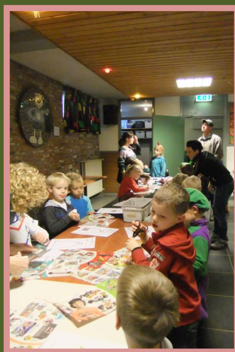
"Pepernotenboom" toveren met de Minioren