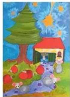
de muizen van het muizenpad doen ook mee met de Kerststalroute