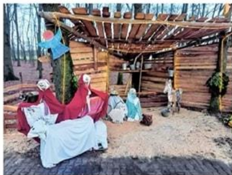
de kerststal bij de Bolster (2022)

24 december tot 6 januari Vanaf 24 december is de Jong Nederland Kerststalroute weer te wandelen/ fietsen. Op de website van Jong Nederland Diessen is de Kerststalroute te downloaden en te volgen. Alle stalletjes zijn mooi en het bezoeken waard. De bijzonderheden: Emmastraat 7 - de kersttuin is dagelijks gratis te bezoeken van 10.00-22.00 uur (t/m 6 januari). Bij een aantal stalletjes staat wat lekkers (snoepjes en laurierblaadjes om mee te koken). Natuurlijk mag hier heerlijk van gesnoept worden, maar JND hoopt dat ook hier de kerstgedachte niet vergeten wordt: samen delen! In de tweede week van de kerstvakantie (donderdag-