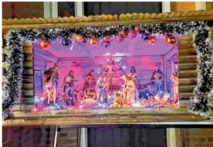
De eerste stallen staan al klaar

Voor wie niet in de gelegenheid is om de route en het spel te vinden via de website, staan er drie brievenbussen in Diessen: De Bocht 3, Meiraap 42, Van der Lindenstraat 14. In deze brievenbussen zitten de routes én de antwoordformulieren voor het spel.