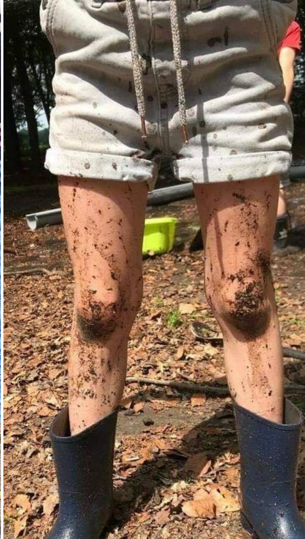
Jong Nederland is... Zon of Regen...een wasmachine is een zegen ♥ Minioren