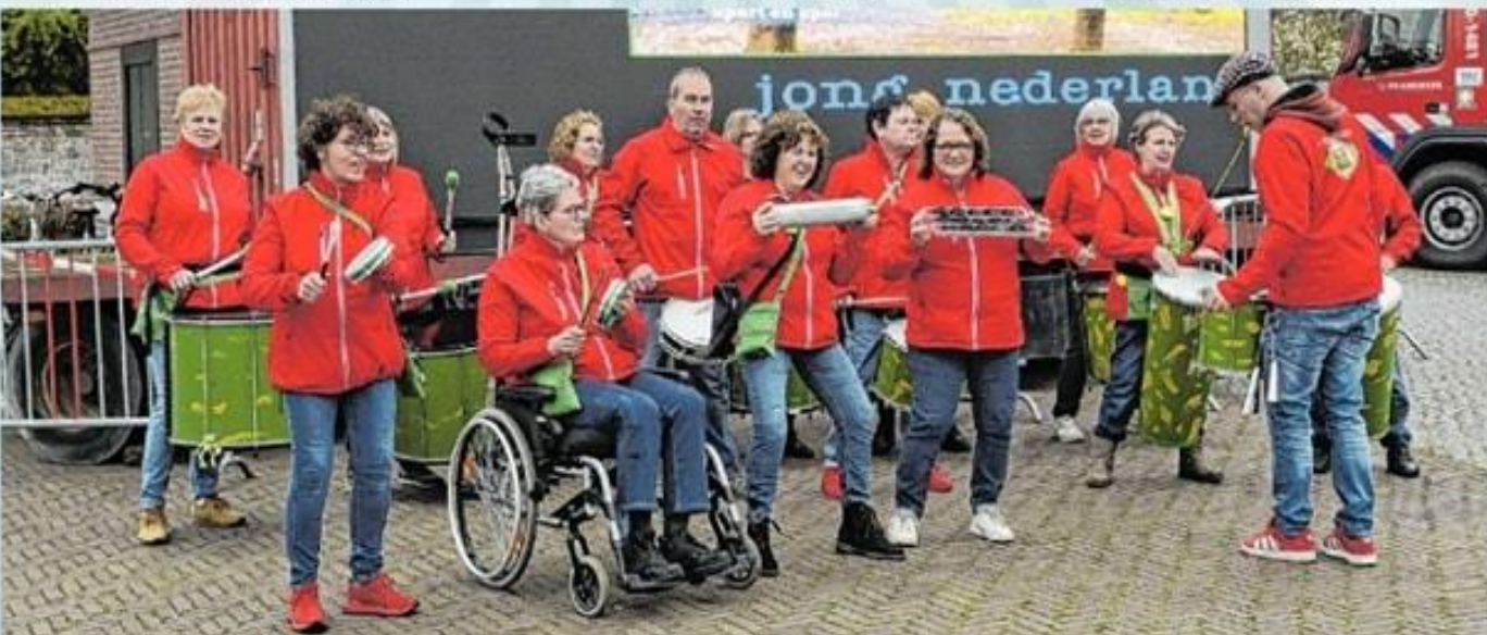
Sambagroep A Batocuda (parkeerplaats Hercules)