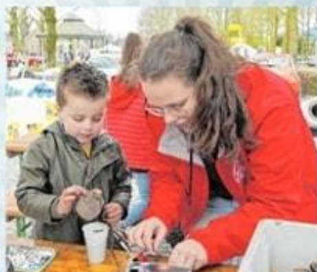
Jong Nederland Diessen (Gildeweide)