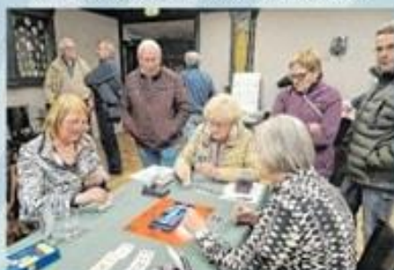
Bridgclub Diessen (Gildesaal Hercules)