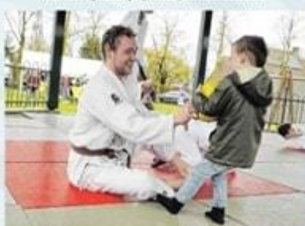
Judovereniging Deusone (Bosk Gildeweide)