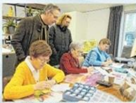
Diamantpointing groep Wij-wel (Eenhoorn)