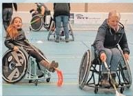
Rollstoel hockey (Sporthal Hercules)