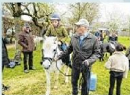
Rijvereniging Isadora (Kloosterlaan)

Het kan de Diessenaren en voorbijgangers de laatste weken niet zijn ontgaan, dat er op zondag 16 april in Diessen een grote activiteit te gebeuren stond. Overal stonden banners met 'Hoe kom je erbij?' Zowat alle vrijetijdsgroeperingen die de voormalige gemeente Diessen tellt, waren op zondag 16 april in het centrum van Diessen aanwezig om zich te presenteren aan de bevolking. Met name om aan de nieuwe inwoners te tonen wat Diessen hen te bieden heeft.