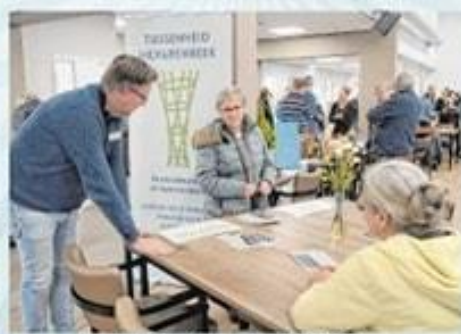
Tussenheid Nijverboek (Eenhoorn)