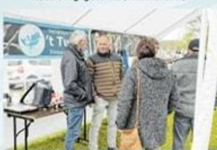
Hengelsportvereniging Turkba (Zijhorst)