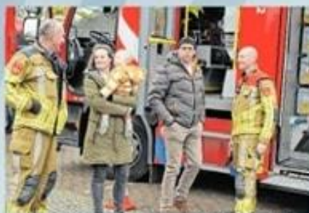
Wijliffe Brandweer Diessen (parkeerplaats Hercules)