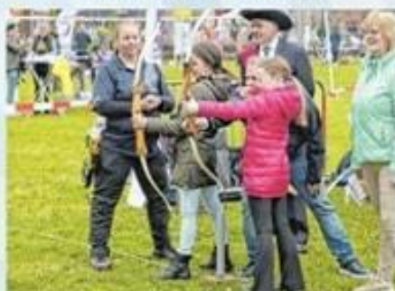
Handboogvereniging Rozenjacht (Gildeweide)